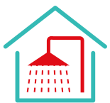
EAU CHAUDE SANITAIRE

Chaudière gaz ancienne alimentant des radiateurs en acier avec robinets manuels.